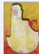
AGENZIA di Quartiere TOR SAPIENZA